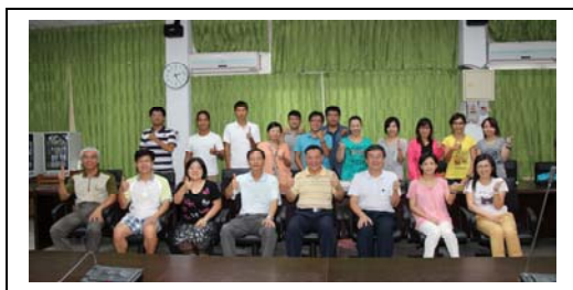
研習活動讓新進老師快速融入學校大家庭

全體新進老師發表研習心得時，特別感謝學校貼心提前安排研習課程，在開學前與全校主管面對面討論校務動態，令人深感難得。大家敬佩學校團隊的精神及態度，未來將會持續精進，為學子開創新的成果佳績。