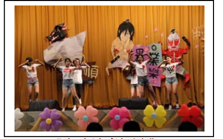
歌舞表演慶賀畢業