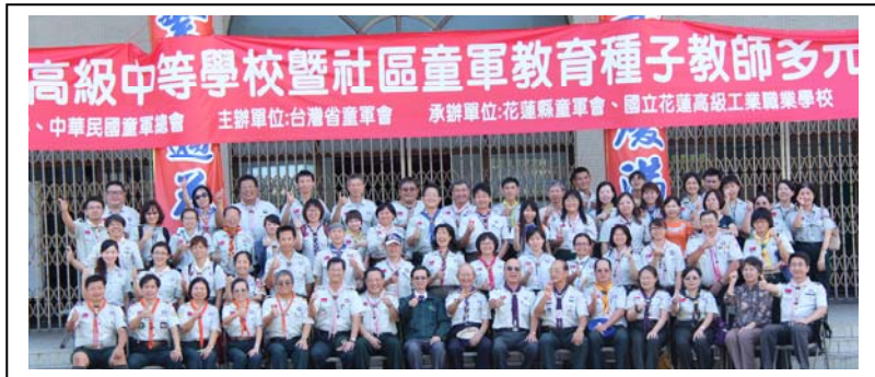
與會人員全體大合照

為期三天的研習活動內容豐富，有團體活動領導與設計、遊戲的設計與領導、實作發表等，學員收穫豐富，對於童軍教育智能的增進與推廣大有幫助，參與人員均感獲益匪淺。