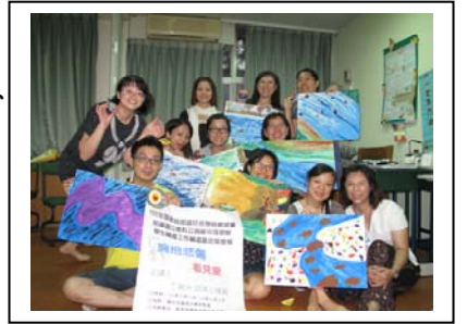
「擁抱悲傷看見愛」讓老師們經歷一場生命之旅，身心靈也獲得洗滌

10 月 14~15 日輔導室承辦教育部國前署所屬高級中等學校輔導團定期會報，參加者為花蓮縣各高中職的輔導教師，藉由定期會報的方式以凝聚彼此情誼、分享各校做法及學習新的諮商模式等。此次由本校主辦，邀請了丁宥允諮商心理師擔任講師，帶領大家「擁抱悲傷看見愛」。丁心理師的專長為悲傷諮商、情緒壓力調適、醫療諮商等。兩天的課程中，她運用了各式各樣的媒材，讓團體成員在製作、冥想、討論、牌卡等過程中開啓生命之門，一起踏上記憶之旅，並藉由轉動心靈之眼、造訪內在殿堂，引導大家回顧並重整自己的失落經驗，在經歷悲傷之後仍能重新啓航，看見曙光。參加團體的輔導老師們在經歷了一場生命之旅後，都覺得身心靈獲得洗滌，並能在自我覺察與領悟的過程中，有更充沛的能量繼續助人工作。