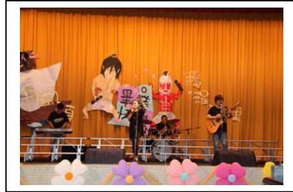
歌舞表演慶賀畢業