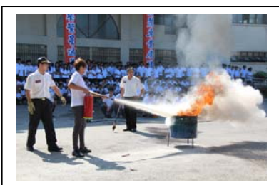
操作確實使用滅火器