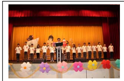
校長主持大會並頒發畢業證書