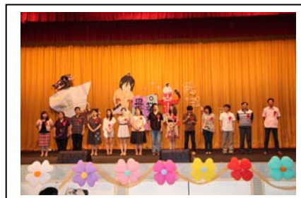
春風化雨的畢業班導師們