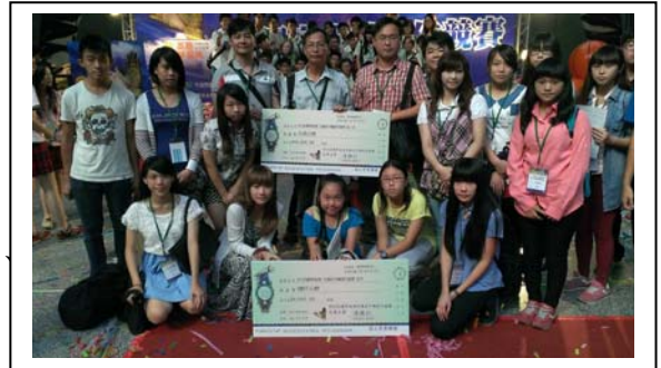
本校發展地方綠建材特色課程，榮獲國科會全國高中職創作競賽學校特色課程第二名。

這次參賽從規劃到比賽歷經半年多，學校老師利用課餘時間研發課程，並帶領學生實做成品及小論文，在暑假期間加強練習，一路挺進複賽決賽，終於有所成，除抱回總計七萬四千元獎金外，更讓具地方產業特色的課程融入日常教學，並達關懷在地、產學合作及特色教學創新等加值目的。