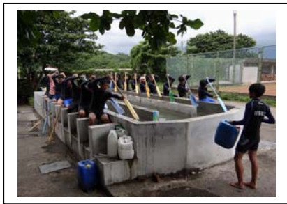
本校擁有花蓮唯一的「盪槳池」，是學生操舟訓練的好設備

「盪槳池」是本校於100年10月，向行政院原住民族委員會爭取專款補助所設置，長11.6公尺、寬3.6公尺的盪槳池，模擬溪流流動，提供操槳練習。此次消防局在盪槳池訓練兩個月、警察局練1個月，本校都注水義務提供場地。校長葉日陞表示，基於資源共享的理念，本校盪槳池不僅讓學生平日練習，在不影響教學下，也提供校外人士、團體申請使用。