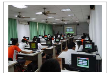
VQC 英文單字檢定測驗