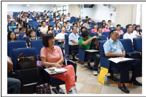
來自五校的研習教師們個個認真聽講

藉由兩天教師專業研習，期待為「教師增能」，並達成五個目的：教師對十二年國民基本教育理念及實施策略之瞭解；強化教師有效教學策略知能，提升學生學習成效，以符應十二年國民基本教育強調適性學習之精神；因應免試入學之學生差異化現象，加強教師差異化教學專業及教學品質；提升教師多元評量的專業與技能，增益學生學習內涵，以培育學生多元能力；增進教師對於適性輔導知能，使每一學生得到最好的照顧，進而成就每一位學生的目的。