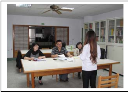
老師們為學生模擬面試並提供意見

為協助高三學生進行升學選校，輔導室於統測結束後辦理一系列之輔導講座，包括備審資料製作與說明課程、模擬面試準備課程以及模擬面試等。並邀請大漢技術學院資工系陳文盛教授、休閒運動管理系黃宗萍主任以及東華大學電機工程學系孫宗瀛教授、藝術與設計學系林彥呈教授為不同升學領域的同學進行面試演練及講解。本校各科老師也投入各場次的面試輔導，指導學生面試禮儀與問題準備，協助同學們在推薦甄選時有最佳的表現。