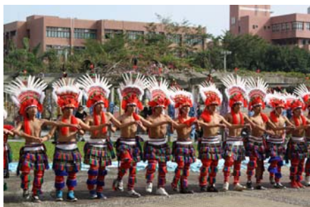
展現力與美的原舞隊