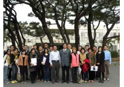
葉校長與桃農團隊 於本校松園合影