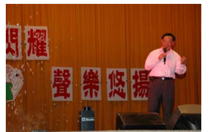
葉校長專業的演唱