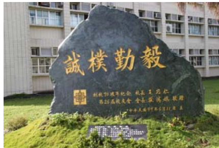
【上左照片】葉日陞校長（中）主持新任（27 屆）校友會長賴有來先生（左）與卸任（26 屆）校友會長莊清祺先生之交接儀式，感謝裝會長一年來對學校的協助，尤其校訓石的捐贈，讓所有校友與在校師長能時時勉勵；也期望校友會在賴會長代領下，繼續給予學校支持與鼓勵。 【上右照片】莊清其會長捐贈之校訓石雕。