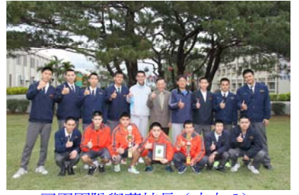
冠軍團隊與葉校長（立右 5）教練（立左 5）、體育組長（立右 4）於松園合影留念