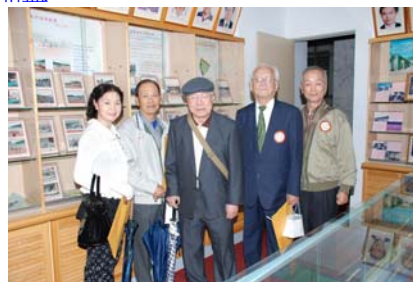
今日校史室開放，不少校友陸續上樓參觀，擷取回憶。