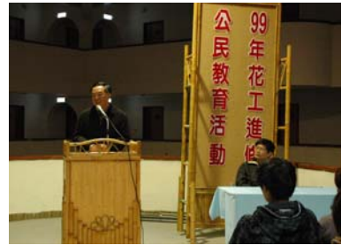
葉校長為同學們演講