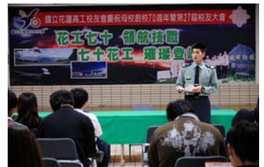
國軍人才招募中心到校說明

為協助高三學生對畢業後的升學及就業進路有更多認識及瞭解，進修學校特於 99 年 11 月 19 日舉辦「生涯進路說明會」。由輔導教師說明四技二專多元入學制度、雙軌訓練旗艦計畫，國軍人才招募中心專人說明志願士兵招募方式。經過一番說明，學生反應對未來進路有更瞭解，將有助於他們畢業後之生涯規劃。