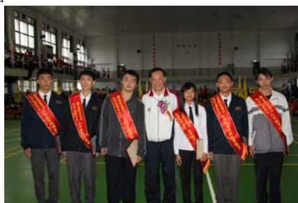
頒發全校模範生獎