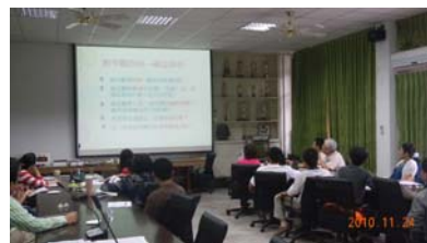
討論規準與自評他評研習

此次研習後，老師們接下來的任務就是完成自評與他評，希望所有老師皆能有所成長，順利通過評鑑！