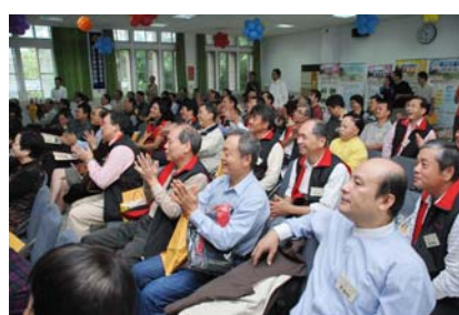
校慶當日校友陸續返校，報到台前顯得熱鬧，大家依序找出自己屆別姓名，快樂簽到；大會會場人氣鼎盛。