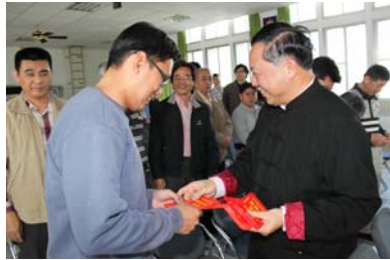
快樂領紅包與彩券，期望中大獎