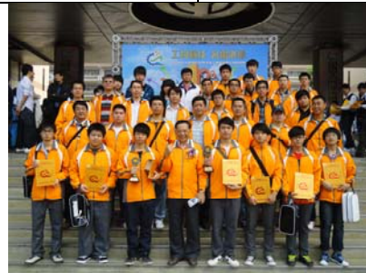
校長(前排左起 4)、主任與指導老師和同學於會場合影留念