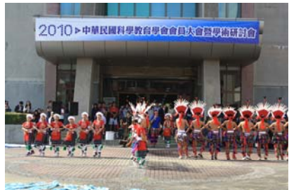
本校原住民舞蹈隊呈現的力與美令人驚豔與讚嘆

演出結束現場貴賓以熱烈的掌聲鼓勵已滿頭大汗的學生舞者們，學生們亦感謝主辦單位能給予公開演出的機會，希望他們的表現能夠讓大家滿意，並且盡到身為鄰居學校學子們的微薄之力。