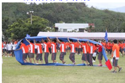
同心協力奮勇向前