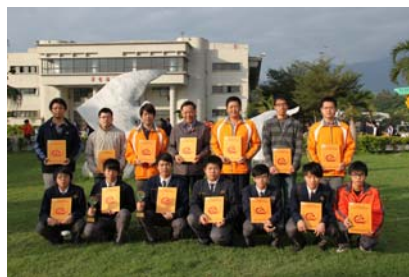
技藝競賽獲獎團隊

三、技藝(能)競賽優異：全國工科技藝競賽爲教育部主辦，全國技能競賽爲勞委會主辦，兩項競賽對高職學生未來升學或就業皆有關鍵性的影響力。