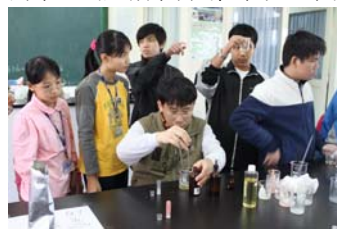
簡易有趣的慕斯洗面乳 DIY 活動