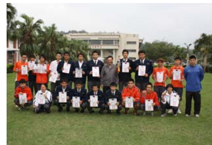
本校優秀體育獲獎團隊與校長於松園合照