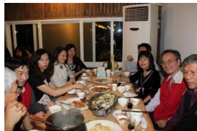
快樂相聚大快朵頤