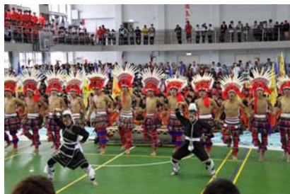
原舞隊力與美的表現