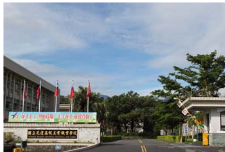
花蓮高工為你開啓技職教育的大門