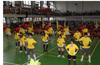
展現青春活潑的進場表演