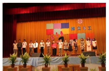
全體畢業班導師獻上祝福