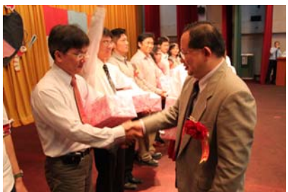
家長會向畢業班導師致意