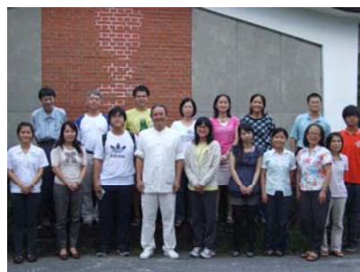
中心辦理網頁視覺設計研習

以上活動要感謝花蓮高工全體協助辦理的師生以及贊助活動的大專、廠商還有參與活動的所有老師及同學。