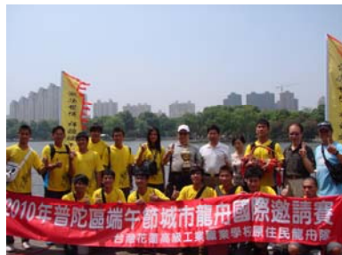
榮耀時刻留下驕傲合影