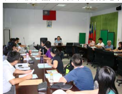
校長主持新進教師研習