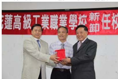
王校長（左）與葉校長（右） 交接印信

典禮中多位來賓的致詞，莊嚴又幽默，讓會場充滿歡樂。對於退休的王校長，我們給予祝福；接任的葉校長，充滿期待，新人新氣象，希望花工的表現，日益進步，更上層樓。