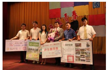
王校長要畢業了，同仁們給他滿滿的祝福