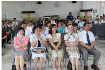
花蓮地區公私立高中職校長 蒞會致意