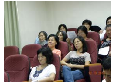
同仁們聆聽法師講說有機生活

法師從佛法山有機生態茶園栽培談起，接著介紹居家簡易有機栽培及有機身心靈養生法，最後是交流分享。參與的同仁對於此次活動都非常認同，希望自己能多實行有機生活。