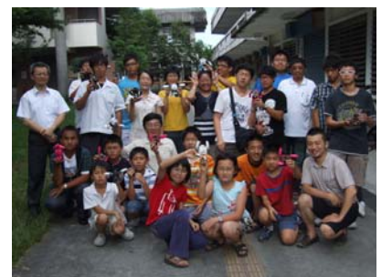
辦理金式世界紀錄最小機器人研習