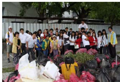
◎參與掃街服務班級

為推動品德教育、增進服務學習機會以及維護社區環境整潔，99 年 10 月 27 日（週三）由學務處規劃、花蓮縣環保志工協會及各班導師協助下，完成乙次大規模的班級掃街活動。此次班級掃街活動採自願參加，共計 11 班將近 400 位同學共襄盛舉。掃街當天兵分六路，沿著府前路及化道路等校園附近街道撿拾垃圾及回收物，並協助清理社區公園的雜草。經此次的活動，除附近街道變得清潔外，更能讓參與同學體認「服務行善」及「發揮公德心」之重要。掃街成果，可怕的豐收！