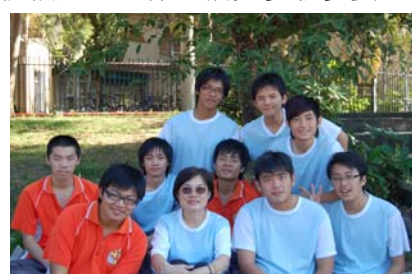
三年級運動會中陳老師與部分同學