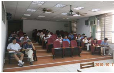
進路會議於圖書館視聽室舉行

爲了協助學生瞭解自我能力、性向與志趣，使學生個人能力、興趣得以充分發展。本校進路輔導委員會於 10 月 11 日委員會會議中，與會主任、老師對實施要點提出不同的看法，並充分討論各項議題。希望規劃完善之升學輔導計畫，導引學生有效學習。