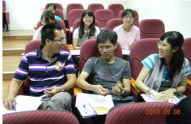
研習會場談笑風生

因應教育部推動品德教育、正向輔導與管教之建議，提供本校教師瞭解品格教育、正向輔導與管教融入課程教學之意涵。於 9 月 8 日上午邀請清華大學兼任諮商心理師及新竹教育大學林祺堂助理教授蒞校演講，講題「學生輔導相關議題——正向管教與輔導」。下午演講「創造力教學——提升幽默的能量」，以教導老師學習使用幽默爲面對教學困難的工具及如何使用幽默技巧，提升教學工作與生活的能量，成爲創造力教學基本能力。