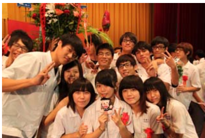
珍重再見，老師，謝謝您！