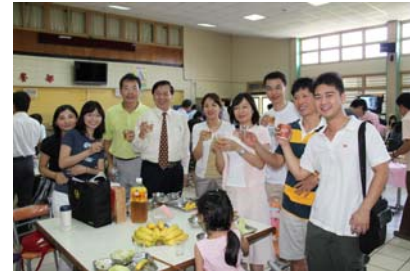
王校長，乾了這杯，下次再相會！

◎2010 高中職數位設計專題競賽，勇奪銀獎、二項佳作、團隊總錦標及優良教師指導獎。