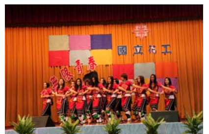
原舞團充滿美與力的表演