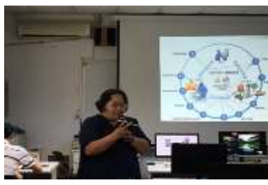
行動學習軟硬體研習