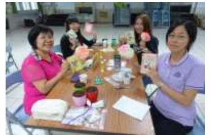
教師製作押花卡片來表達四道人生：「道謝、道歉、道別、道愛」