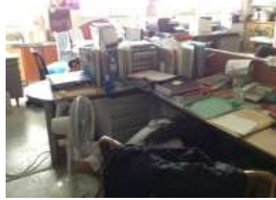
教職員工在辦公室配合避難