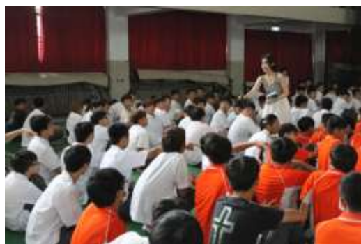
王子麵講師現場與學生互動熱烈

她並指出，藝術在於抓美感創作，就像人生必須於及時行孝、珍惜擁有，才會富足而沒有遺憾。學生在座談中踴躍發問，無論是生活上的問題還是創作上的困擾，她都一一詳細回答。會後師生均對於這場生動活潑的講座表示喜愛與肯定，希望之後能多辦一些如此有意義的活動。