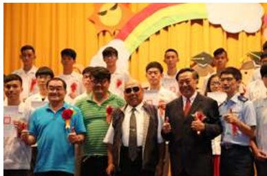
家長會長、來賓(左)頒獎與祝福