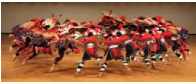
奪得全國學生舞蹈比賽優等獎的原舞隊帶來超水準演出