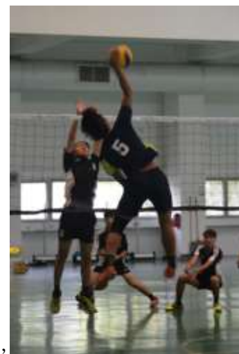
排球手的攻擊英姿

兩隊在雙雙挺進冠軍戰後，靠著教練靈活的球員調度、戰術運用及球員們攜手努力，終於不負全校師生期望，勇奪本屆幸福城市盃籃球、排球雙料冠軍，締創賽史最佳成績紀錄。