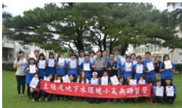
校長(中)與獲證同學合影