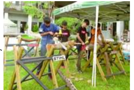
參與同學們在花農森林科體驗用電鋸切割木頭

跨校特色社團已經行之有年，是由花蓮高商主辦，花蓮高農、花蓮高工、海星高中協辦，本校為今年新加入的生力軍，讓學生習得產品設計、創意發想、包裝及行銷設計概念。藉著交流專業，看到各校的專長與特色來激發學生創意，也能學習溝通與協調的能力。