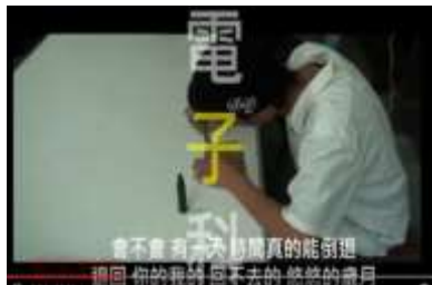
學生製作畢業影片