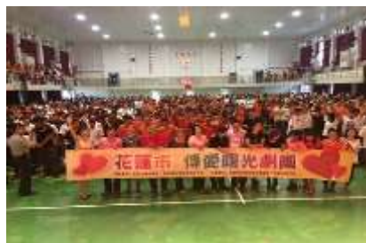
表演結束與師生合影