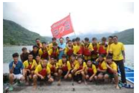
校長三天全程陪同比賽