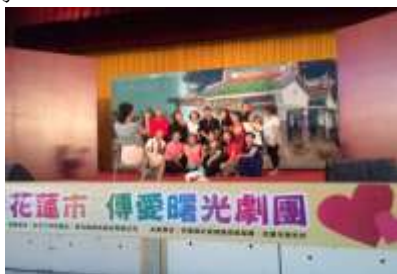
「傳愛曙光」劇團表演

此次演出針對校園青少年，傳愛曙光劇團特地調整了台詞及肢體表現，以青少年不受具危害性成癮物質控制，享受真正的自由為主軸，演出現場學生氣氛熱烈掌聲笑聲不斷，與台上相互回應共鳴。