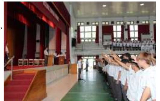
「反毒、反黑、反霸凌」是我們的堅持