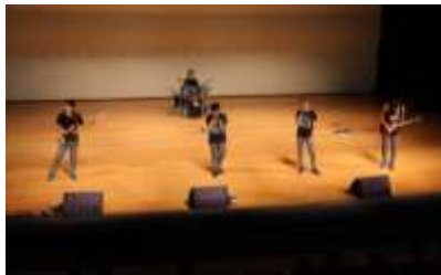
各社團精湛的演出