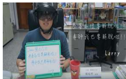
畢業班導師拍攝影片祝福學生