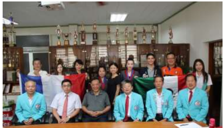
扶輪社一行人與校長(前排中)、教務主任(後左 1)合影