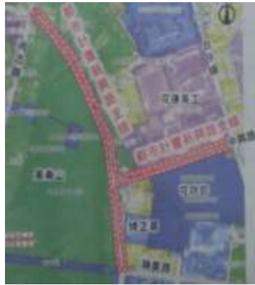
新興路拓寬工程

隆成工程顧問有限公司由專人說明，包括路線規劃、主線與支線道路的斷面設計、道路排水、管線配置、環境友善生態的規劃等，而營建署也在一旁補充說明，讓與會人員能了解整個工作的規劃與目前進度。