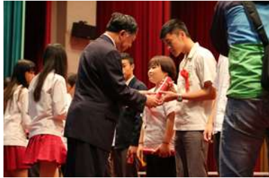
校長主持大會並頒發畢業證書