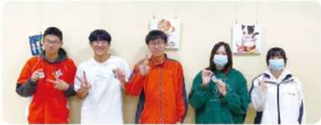
學生們開心分享自己完成的作品，充滿成就感