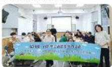
活動大合照及頒發講師感謝狀