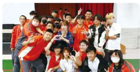
學生與團員熱情合影

【學務處】如果劇團工業安全校園巡迴演出，10月18日出現在花蓮高工了，透過有趣的話劇與演唱，讓全校師生學到了相關的工業安全知識，也享受了一場華麗的舞台劇，陶冶師生身心靈。