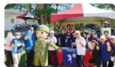
校慶運動會各處室同仁協同國軍弟兄進行反毒宣導

【教官室】為加強防制學生藥物濫用的情形，教官室每學期皆會利用相關校園活動(如：友善校園週、月會活動、校慶運動會、親師座談會等)進行反毒政策宣導及防制作為，績效相當卓越，屢獲教育部肯定。