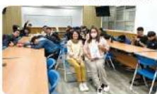
活動大合照及頒發講師感謝狀