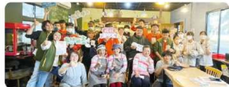
幸福50+~探訪夢想咖啡館大合照

在沖煮出的香醇咖啡香中，我們感受到熟齡族的夢與熱情，同時也激勵花工學子年輕的心，勇敢逐夢。