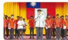
獲獎學生發表得獎感言，分享心得並訓練膽量

【學務處】112學年度開始，每月其中一週的週三第七節課，為全校月會活動，進行全校性的宣導與頒獎活動，藉由本學年度開始推行的三好校園計畫，提倡全校一同做好事、說好話、存好心，也藉此活動訓練學生在全校面前發表自己的獲獎感言。