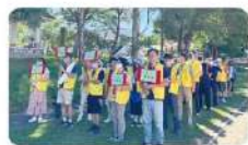
全校教職員工依任務編組進行防災演練

【學務處、進修部】每年的9月21日為國家防災日，全校教職員工生展現平日建立的防災觀念與練習成效，為不可預測的災害做最好的準備，除了全校學生進行防災演練，教職員亦是全體動員分組演練，做到全校總動員，只為災害發生時能有充分準備。