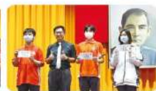
生活榮譽競賽頒獎落實三好教育精神