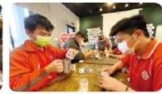
學生們製作咖啡館特色產品：擴香石