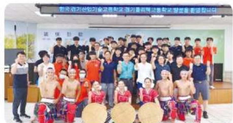
韓國坪村科學技術高中來訪

【學務處】9月7、20日，韓國坪村科學技術高中、韓國京畿第一工業技術高中蒞校參訪，從原住民歡迎舞蹈到一同共舞，從學校交換禮物到學生交換聯絡資訊，從參觀各科工廠到分享兩校相同之處與互相學習特色，再再都提升學校與學生的國際交流，展現朝國際發展的目標。