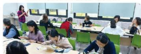
配合餐盒及研習材料完成穀物分類學習單