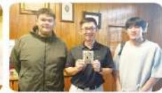
學生贈送校長專屬咖啡包