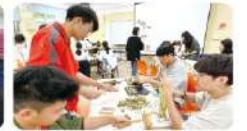
原住民工藝：樹皮文創師生共學講座