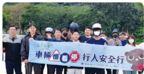
交通安全-機車考照推展