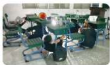
進修部同學模擬地震發生實地演練