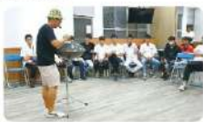
現場彈奏手碟空靈的聲音