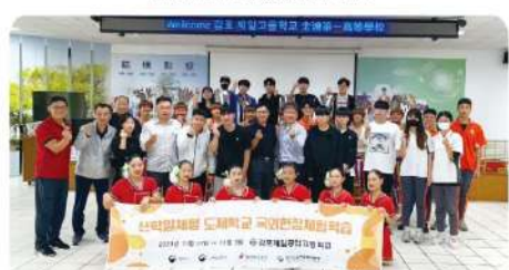
韓國京畿第一工業技術高中來訪