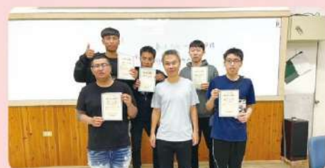
進修部同學手寫卡片送上對師長最高的祝福