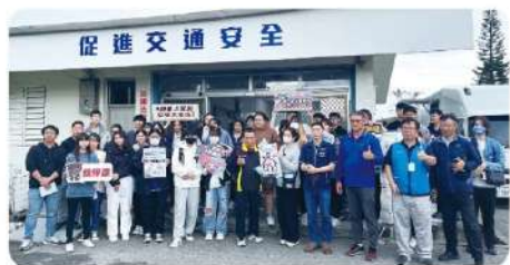
機車安全駕駛體驗活動

【學務處、教官室】高三同學陸續年滿18歲了，進入會使用機車代步的時期，本校為降低學生使用機車發生意外的機率，除將交通安全教育融入課程中教學外，還特地與花蓮監理站、名人駕訓班合作，於11月25、26日，帶領要考照的同學先經過正統的安全駕駛訓練，再參與考取駕照，期望能建立正確的駕駛觀念與降低事故的發生機率。