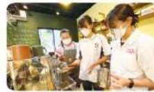
學生們在咖啡師的教導下沖泡屬於自己的咖啡