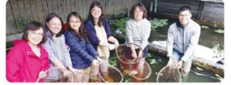
教師社群做馬太敏戶外自主學習