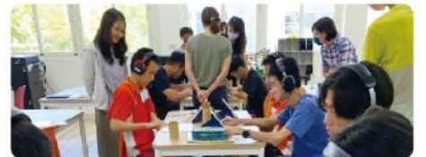
辦理與日本高校國際交流觀學活動

【教務處】本校高職優質化計畫，每學期皆辦理許多豐富多元的研習活動或講座，範圍涵蓋「國際教育」、「生命關懷」、「自主學習」、「專題實作」、「原民文化」等，除提升教師專業知能外，也拉近師生間的距離，增加彼此的信任。