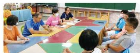
與美崙國中共同討論「我愛美崙」的跨域課程設計

【教務處、技教中心】本校參與學習區完全免試計畫，逐步朝「全面免試，就近入學」的方向邁進，為加強與國中端課程合作，落實資源共享的精神，本學期與學習區內兩所國中(美崙國中、壽豐國中)共同研發六年一貫課程，深化高中職與國中的縱向課程連結，使學生的學習不中斷，往後課程的銜接也更順利。