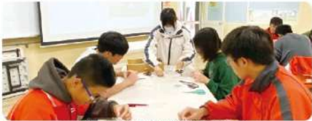
輔導室志工教導學生製作押花鑰匙圈

【輔導室】藝術手作為近年來興起的紓壓方式，透過藝術的創作與手作時的專心投入，能讓自己的情緒得到紓解，並在完成作品後獲得成就感。11月17日輔導室利用午休時段，辦理生命教育紓壓教室，由輔導室志工擔任講師，進行押花鑰匙圈製作，參與的學生認真投入在藝術創作之中，透過挑選乾燥花媒材、黏貼，感受色彩及花樣變化等創作歷程，體驗不同以往的紓壓活動。參加這次活動的學生對於自己所創作的押花鑰匙圈都感到非常驚喜和驕傲。