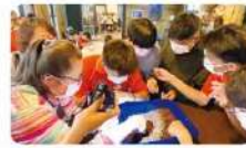
學生們學習如何挑選品質優良的咖啡豆