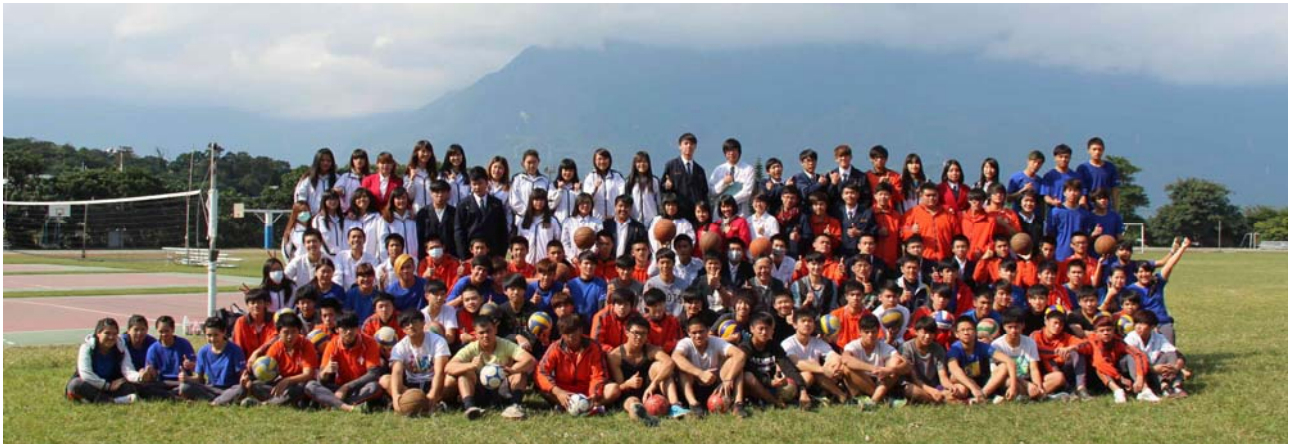
2014 年將參加全國複(決)賽的花工原舞隊. 合唱團. 籃球隊. 排球隊. 足球